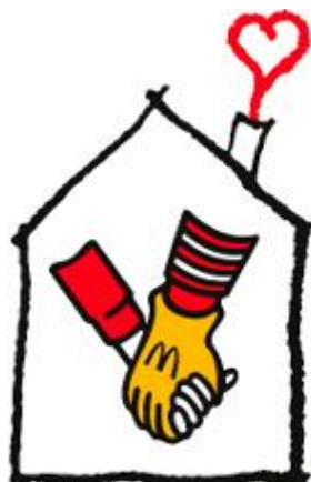
FUNDACJA RONALDA MCDONALDA

Fundacja Ronalda McDonalda jest organizacją pożytku publicznego, działającą w Polsce od 2002 roku. Fundacja jest związana z międzynarodową organizacją charytatywną Ronald McDonald House Charities, działającą w 57 krajach świata na rzecz zdrowia i rozwoju dzieci. W Polsce głównym projektem Fundacji Ronalda McDonalda jest ogólnopolski program "NIE nowotworom u dzieci". Fundacja stawia na poprawę wczesnej wykrywalności chorób nowotworowych u najmłodszych, organizując badania USG, szkoląc lekarzy podstawowej opieki zdrowotnej, inwestując w wydawnictwa propagujące aktualną wiedzę w dziedzinie onkologii.