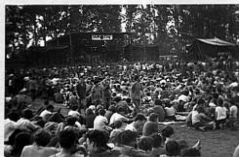
CZEŚĆ STADIONU PRZED ESTRADĄ

Narodowej. Był to album "Jarocin. W obiektywie bezpieki" z niepublikowanymi dotąd dokumentami na temat infiltracji festiwalu przez Służbę Bezpieczeństwa PRL. Skala tej inwigilacji okazała się porażająca. W zbiorze znalazły się m.in. wykonane przez esbeków analizy struktur subkultur młodzieżowych, liczne zdjęcia dokumentujące ich wygląd oraz prywatne dane członków zespołów grających na festiwalu. Pod lupą tajnych funkcjonariuszy znalazły się środowiska punkowców, satanistów, skinheadów, heavy metalowców i hipisów. Agentów interesował nie tylko ich wygląd, ale również sposób organizacji i filozofia, jaką się kierowali. Obserwacją objęto także środowisko oazowców i ludzi związanych z "Monarem" Marka Kotańskiego. Szukano również "haków" na organizatorów festiwalu, mających rzekomo przemycać pod jego osłoną treści podżegające do bojkotu władzy.