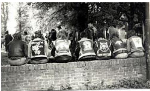
PRZYKŁADY ZNAKÓW ROZPOZNAWCZYCH

jednej strony jest to wiedza, która wciąż drugiej jednak to wciąż materiał, wiele zarzucić. Bo w tym wszystkim esbeków umykała muzyka i słowa padały z festiwalowej sceny. I uczucie udzielało się wszystkim uczestnikom