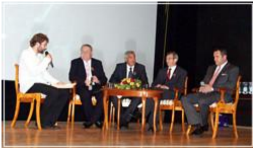
Uroczystość uświetnił benefis z udziałem burmistrzów Jarocina wszystkich kadencji.

objęciu stanowiska burmistrza, o trudne decyzje, które musieli podjąć w trakcie swoich kadencji, a także o ich wizje Jarocina za 20 lat i marzenia z nimi związane. Po benefisie zostały wyświetlone prezentacje multimedialne, obrazujące najważniejsze wydarzenia i inwestycje gminy Jarocin z ostatnich 20 lat.