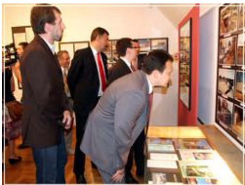
Muzeum Regionalne w Jarocinie z okazji jubileuszu przygotowało okolicznościową wystawę.

Wczoraj w Jarocinie świętowano 20 lat odrodzonego samorządu gminnego. Na obchody zostali zaproszeni burmistrzowie miasta i radni wszystkich kadencji, którzy przez pięć kadencji pracowali na dzisiejszą pozycję i wizerunek naszego miasta.